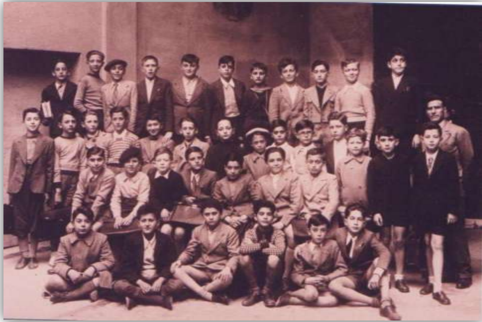
1936-1937 - IV ginnasiale