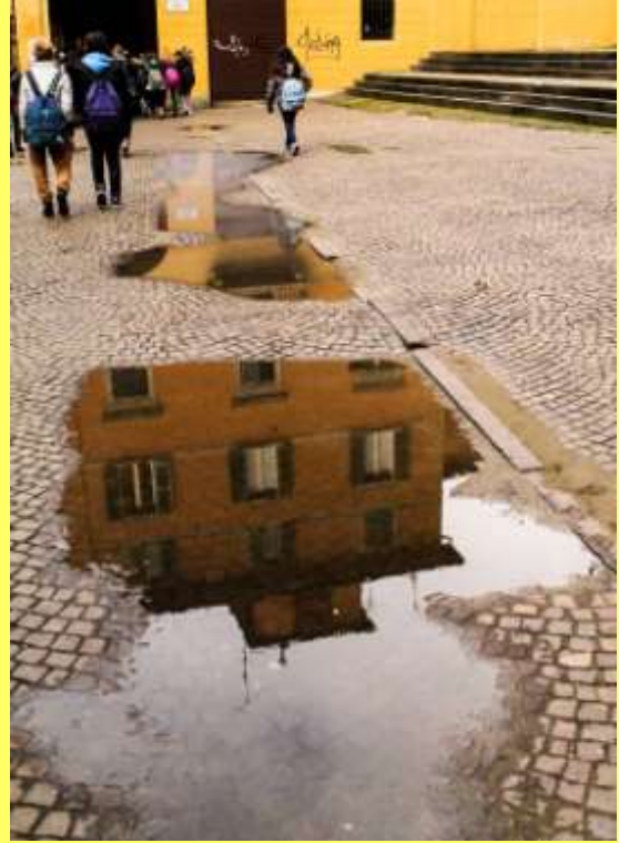
Cacciamani (4 L)