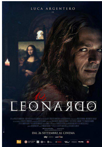
Secondarie I e II grado