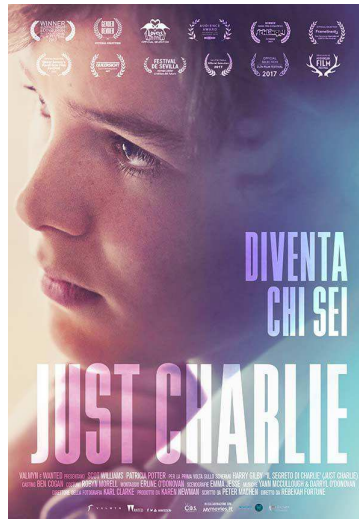
Secondarie I e II grado